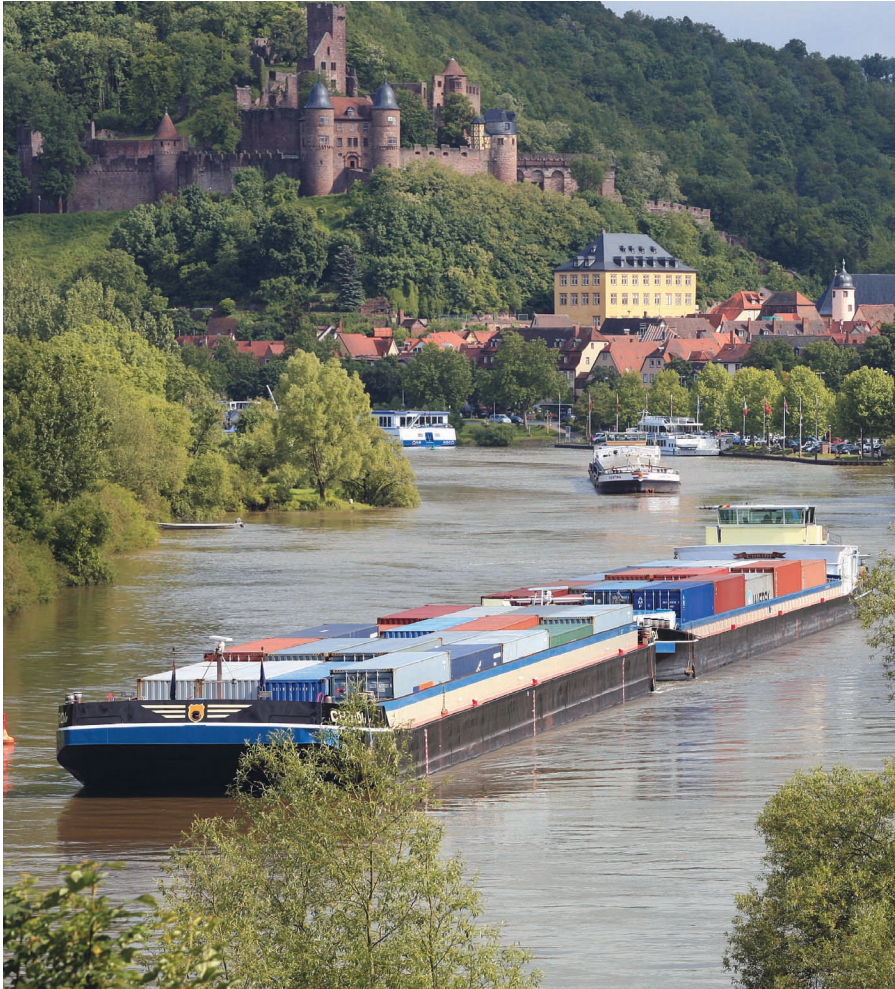
Verkehrspolitik ist ein wichtiges Feld der Metropolregion Stuttgart. Zu ihr gehört auch der Main bei Wertheim, den Containerschiffe als wichtige Wasserstraße nutzen.